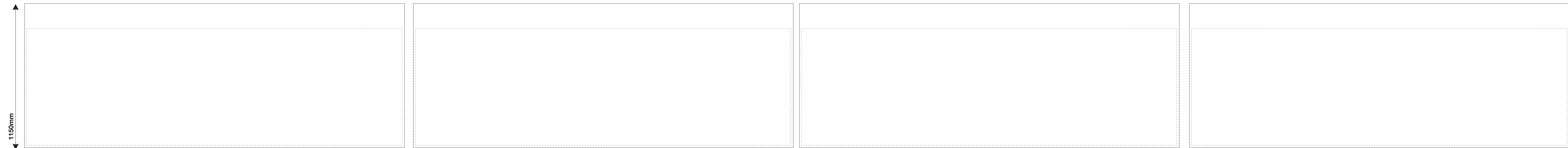
Fram Halv vägg